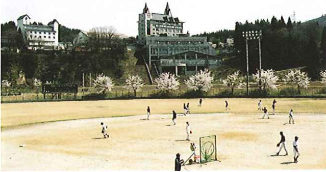
胎内球場とロイヤル胎内パークホテル

野球場・テニスコート・体育館・芝グラウンド・ゴルフ場などのスポーツ施設を周辺に構えるホテル