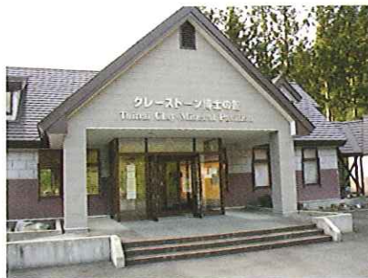
クレイ・ストーン博士の館