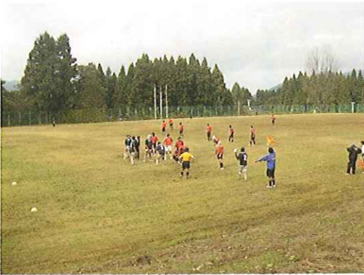
ラグビー部の合宿風景（芝グラウンド）