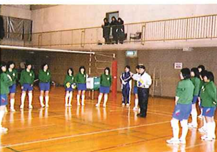
バレーボールの合宿風景（レクホール）